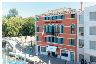
Hotel Santa Chiara Venice

Vier Nächte im guten Mittelklasshotel Santa Chiara Venice (off. Kat. ****).