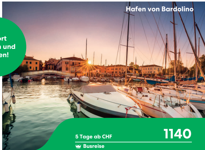
Hafen von Bardolino