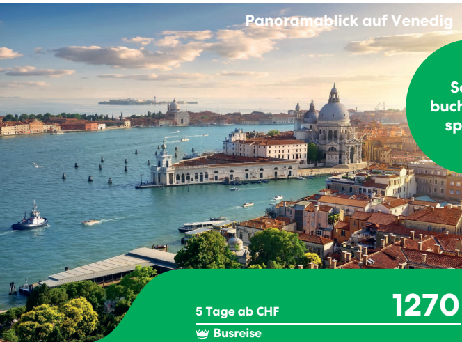
Panoramablick auf Venedig