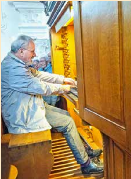
Die letzte original erhaltene Silbermann-Orgel im Dom Arlesheim

Auf unserer letzten Führung im alten Jahr erfuhren wir vom kundigen Herrn Koller Interessantes über die Geschichte und Architektur des Doms: Er ist ein opulentes Rokokojuwel und das Wahrzeichen von Arlesheim. Er wurde 1681 eingeweiht und 1814 vor dem Abbruch durch die Gemeinde gerettet. Leider wurde der Dom jeweils gemäss dem Geschmack der Zeit renoviert und erst im 20. Jahrhundert von den Überlagerungen gereinigt und in die ursprüngliche Fassung gebracht.