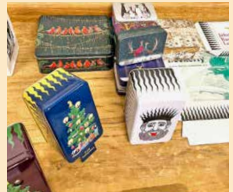
Mannigfaltige Dosenpracht in der ältesten Schweizer Biscuitmanufaktur

Das Interesse im Februar war so gross, dass wir auf einen späteren Zeitpunkt eine zweite Führung organisierten.