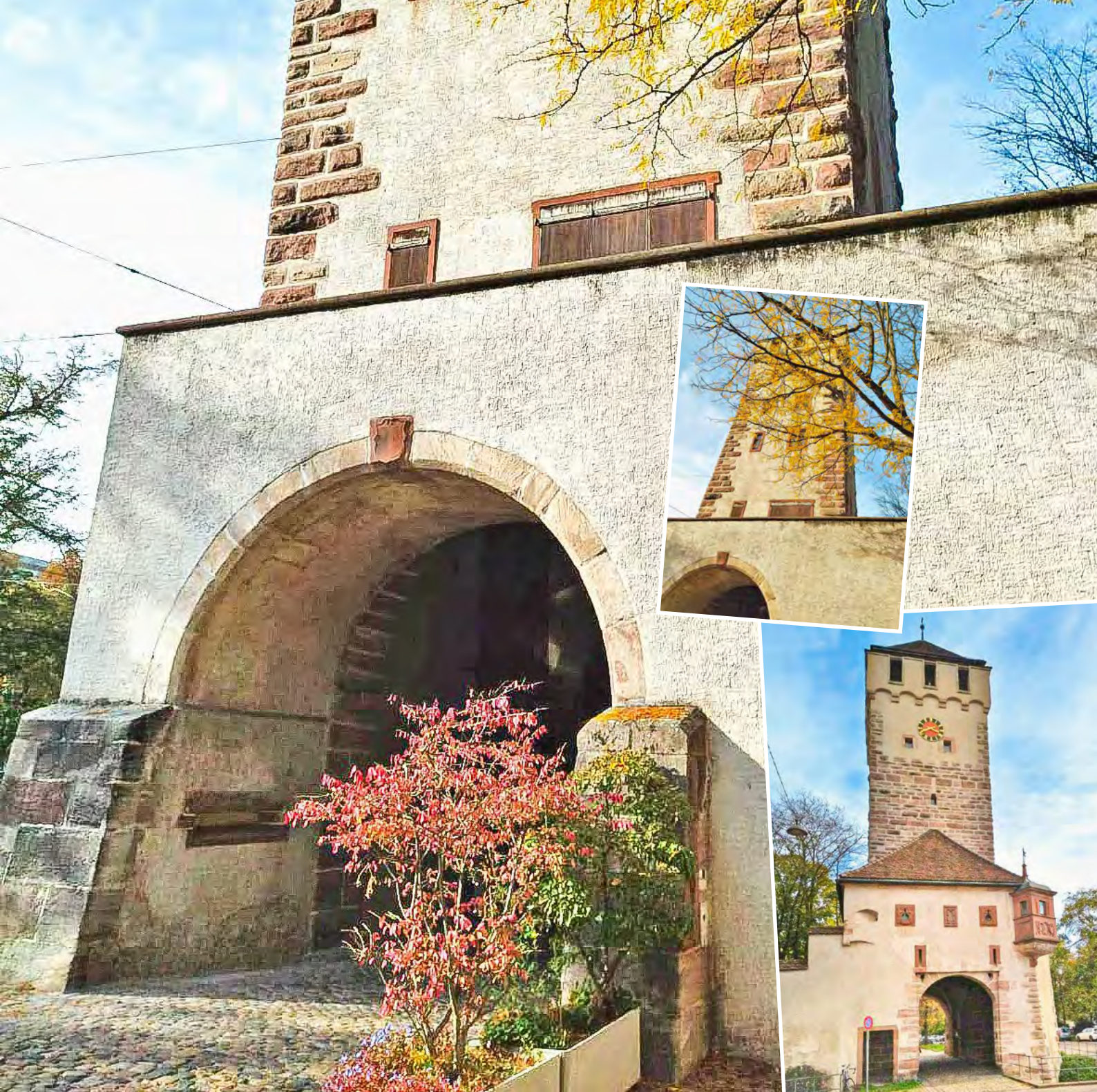
Das St.-Johanns-Tor stiess auf Interesse beim SVNW-Publikum.