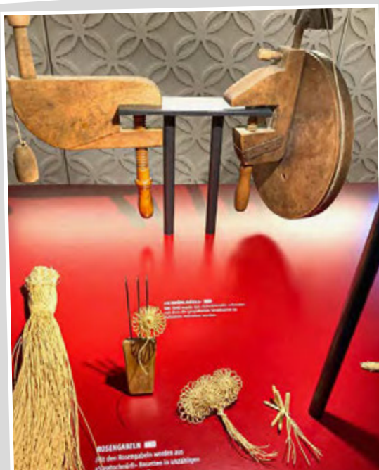
Impressionen der Handwerkskunst im Strohmuseum Wohlen.