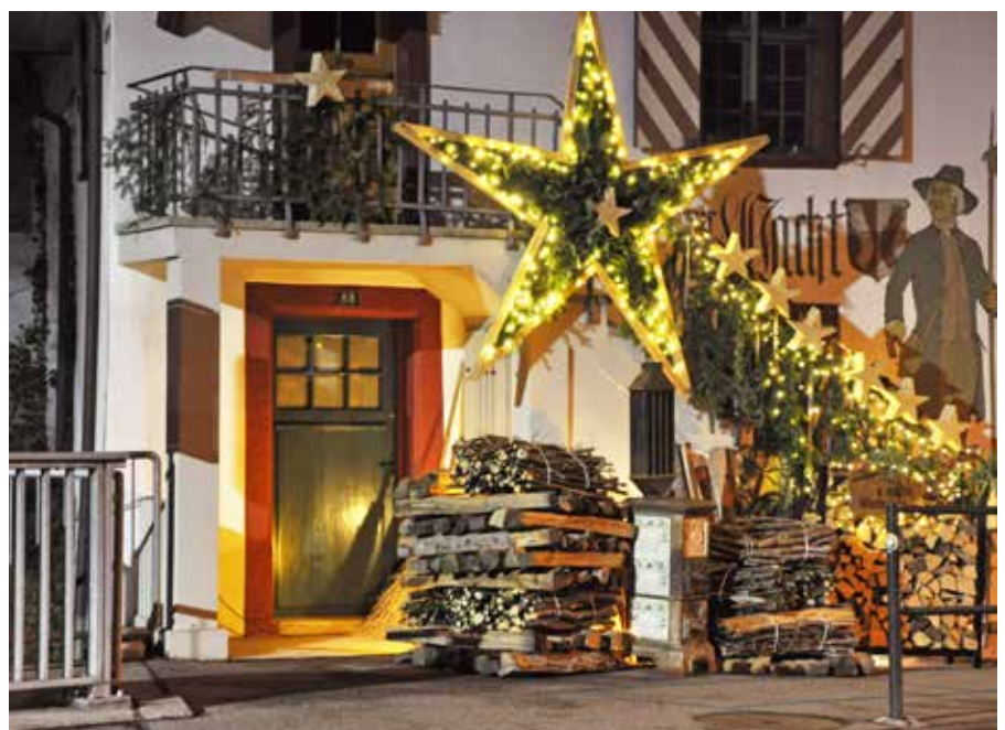
Die autonom-Redaktion und der SVNW-Vorstand schliessen sich den nebenstehenden Wünschen im Editorial des SVNW-Präsidenten an: Wir wünschen Ihnen ganz schöne Weihnachten und alles Gute im neuen Jahr.