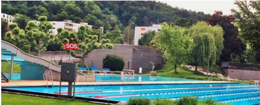
Leere Schwimmbahnen: Symbol für den Ausschluss von über 65-Jährigen vom Vereinstraining.

So lautete der Titel eines Artikels im Onlinemagazin Prime News am 13.5.2020 – das ist ein weiteres Beispiel von Altersdiskriminierung, gegen die sich der SVNW wehrt.