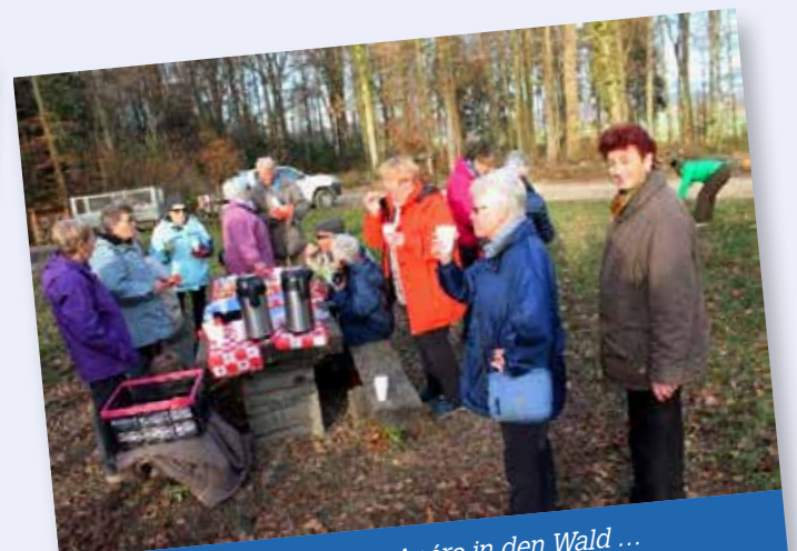
... zum Wandern und zum Apéro in den Wald ...