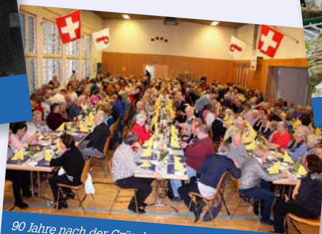
90 Jahre nach der Gründung: gemütlicher Nachmittag des AVO im Jahr 2019