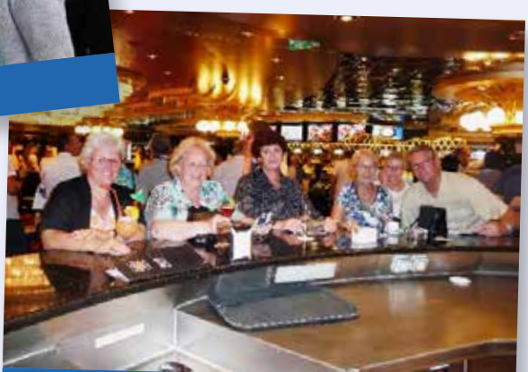
... mit dem Kreuzfahrtschiff in Griechenland ...