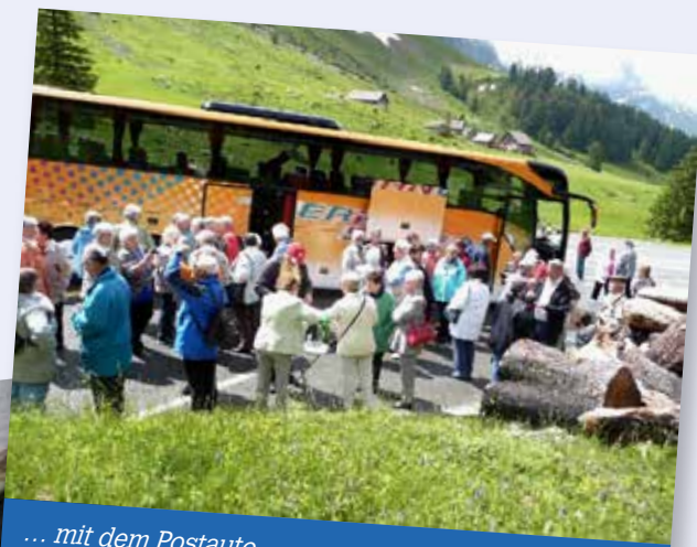
... mit dem Postauto