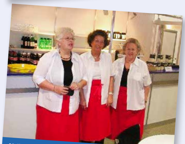
Voller Einsatz an der Muba