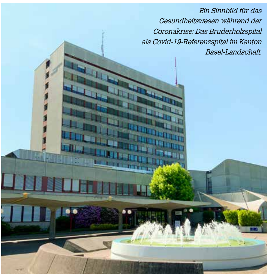
Ein Sinnbild für das Gesundheitswesen während der Coronakrise: Das Bruderholzspital als Covid-19-Referenzspital im Kanton Basel-Landschaft.