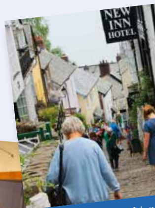
Ausflüge des AVO hier