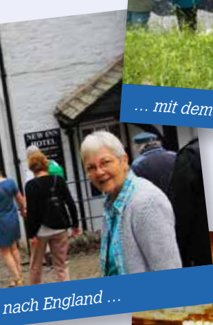
nach England ...