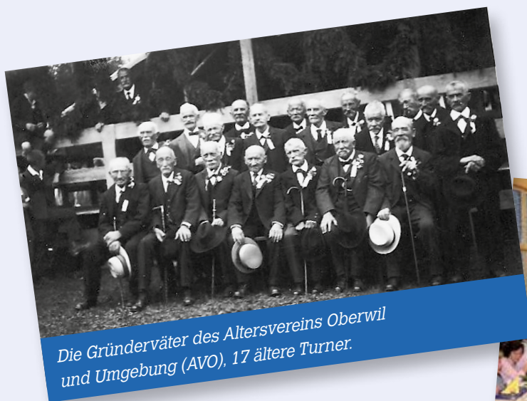
Die Gründerväter des Altersvereins Oberwil und Umgebung (AVO), 17 ältere Turner.

Wir bemühen uns sehr, schöne Fahrten auszusuchen und ein gutes Essen zu offerieren. Die monatlichen Wanderungen sind gut besucht, und einmal im Jahr