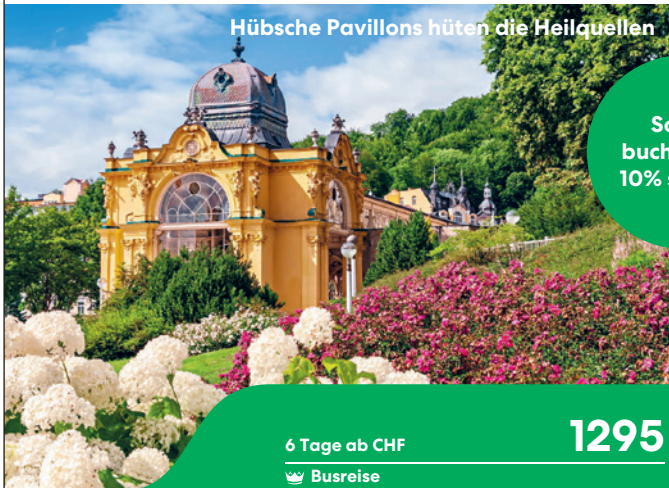
Hübsche Pavillons hüten die Heilquellen