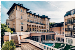
Falkensteiner Spa Resort (off. Kat. *****)

Fünf Nächte im eleganten Luxus-hotel in Marienbad mit 2'500 m 2 grosser Wellnessoase.