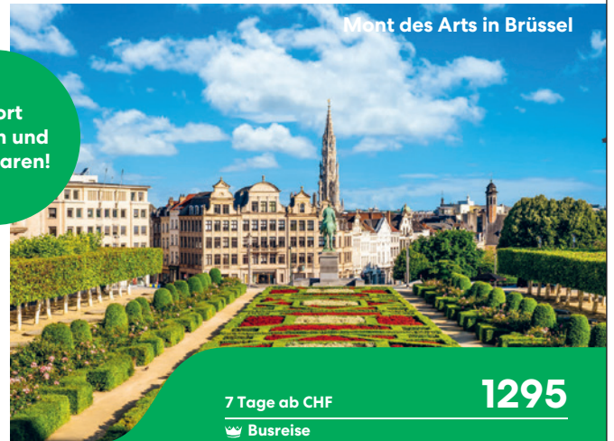
Mont des Arts in Brüssel